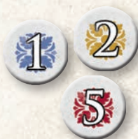
24 büntetőpont jelző („1”-es, „2”-es és „5”-ös)