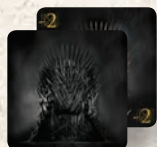
7 Vastrón kártya