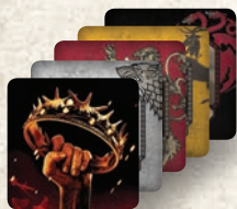
36 karakter kártya