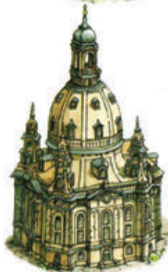
Frauenkirche (Drezda, Szászország)

A drezdai Frauenkirche 1726 és 1743 között épült fel, barokk stílusban. A II. világháború légitámadásai során súlyosan megsérült és 1945. február 15-én össze is dőlt. Az újjáépítése 1994-ben indult meg és tizenegy évvel később fejeződött be.