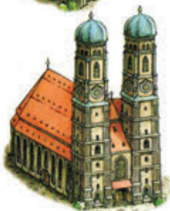
Frauenkirche (München, Bajorország)

A Frauenkirche Bajorország fővárosában áll, későgótikus stílusban épült. 1494-ben szentelték fel. Majdnem száz méter magas tornyaival jelentősen meghatározza München látképét.