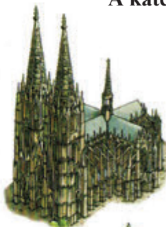
A kölni dóm (Észak-Rajna-Vesztfália)

A kölni dóm a legnagyobb gótikus katedrálisok egyike. Az építését a 13. században kezdték, de teljesen csak a 19. századra készült el. A templomot az UNESCO világörökségnek nyilvánította.